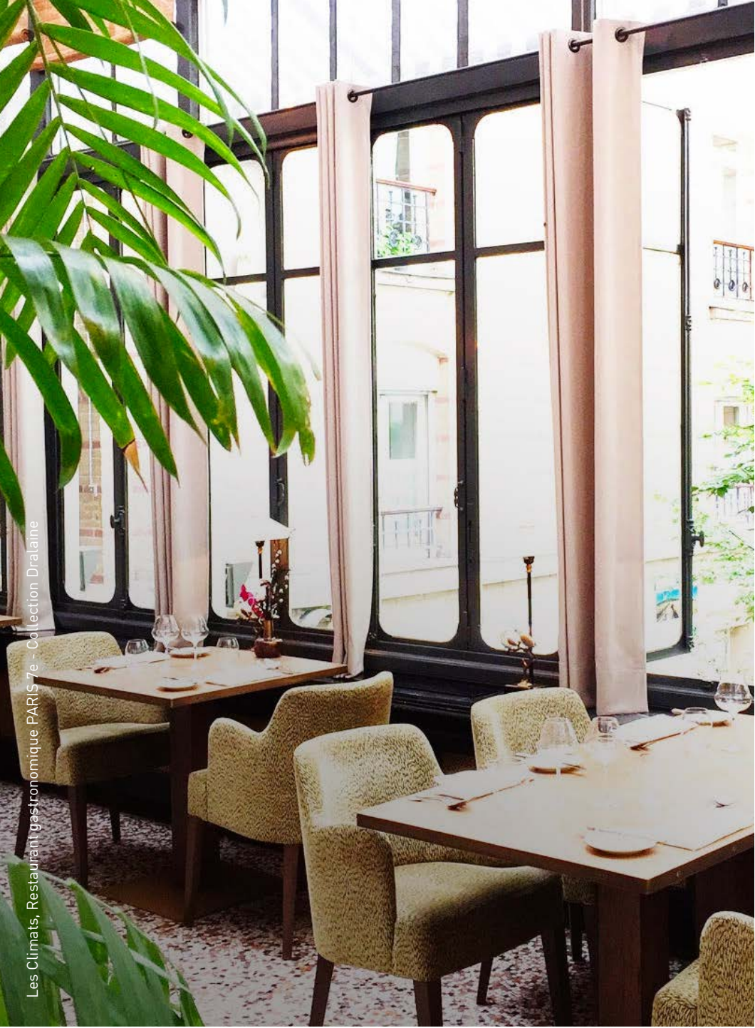
Les Climats, Restaurant gastronomique PARIS 7 e