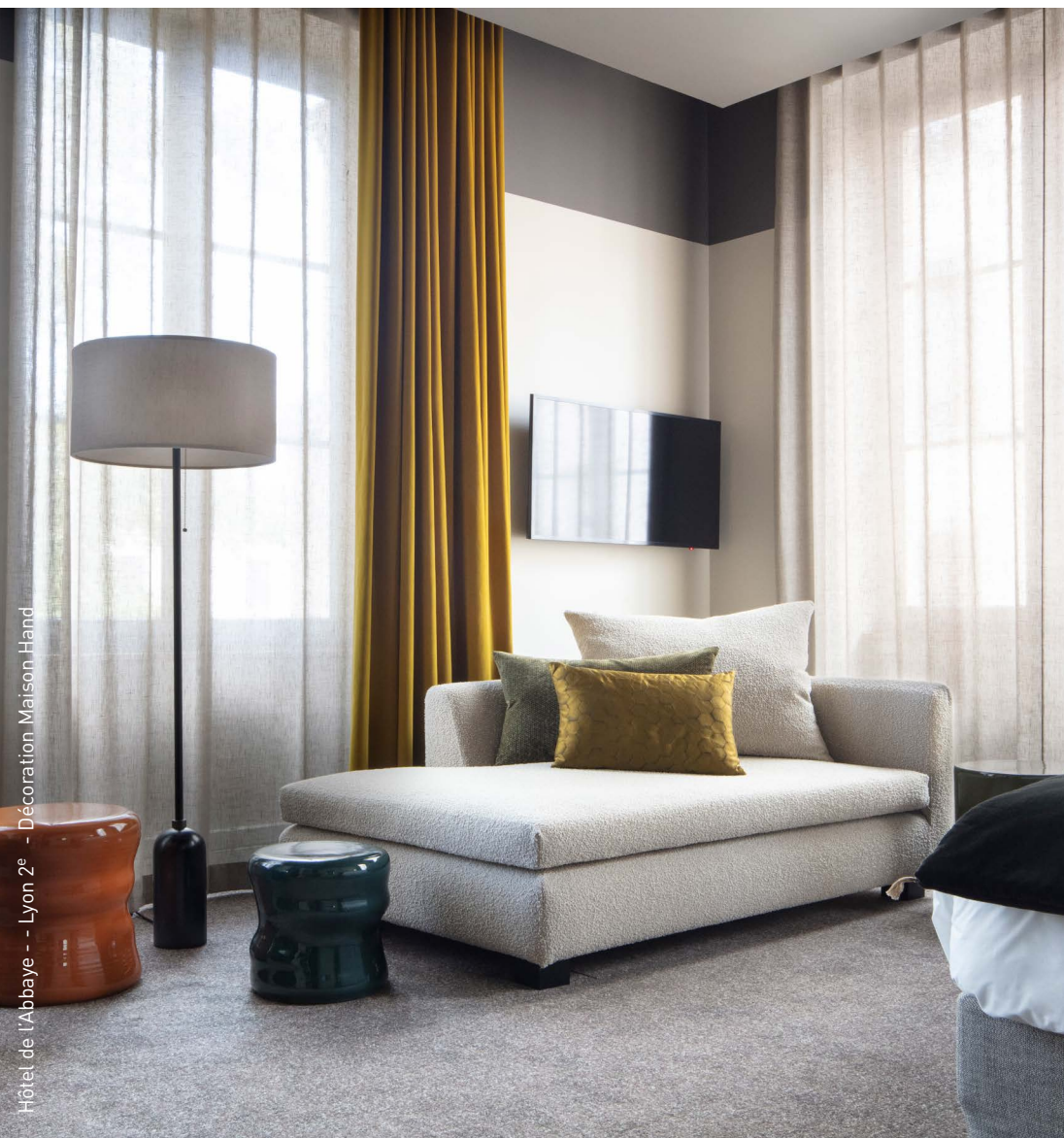
Hôtel de l'Abbaye - Lyon 2 e - Décoration Maison Hand