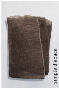
simple d' abaca