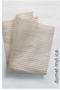
dumet myl. ice