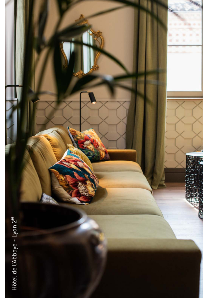
Hôtel de l'Abbaye - Lyon 2 e

Large gamme qui propose des tissus dans des fibres non feu pour sièges, voilages et rideaux, dédiés au marché des collectivités, bureaux, hôtellerie et restaurants.