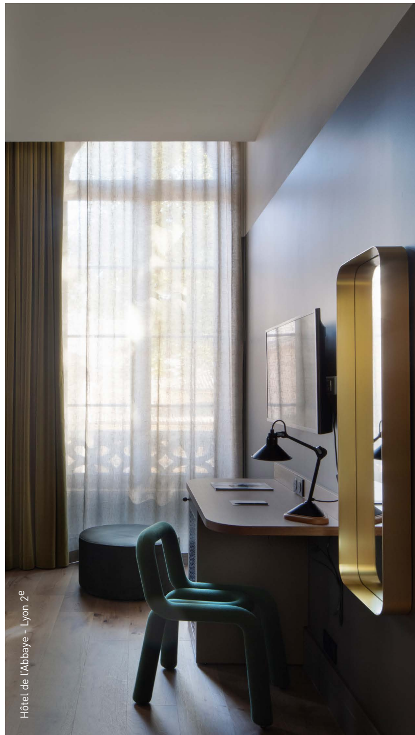
Hôtel de l'Abbaye - Lyon 2 e